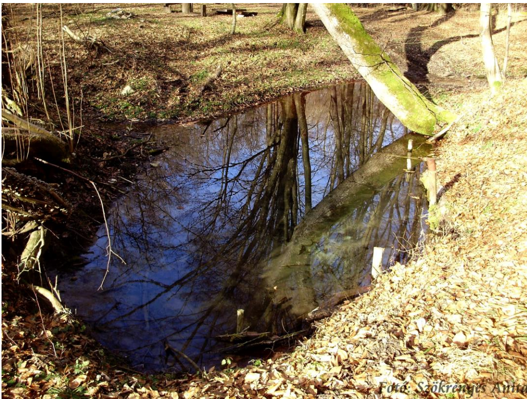
Tiszta-víz, a Bakony legnagyobb forrása

1. Az értéktárba felvételre javasolt nemzeti érték fényképe vagy audiovizuális-dokumentációja