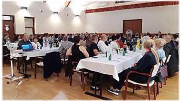
Márkus Zoltán polgármester

Tisztelettel hívunk minden bakonybéli lakost a május 26-án, a szentmise után, kb. 3/4 11 órakor tartandó Hősök Napja megemlékezésre.