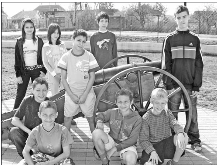
Országos döntőbe jutottak