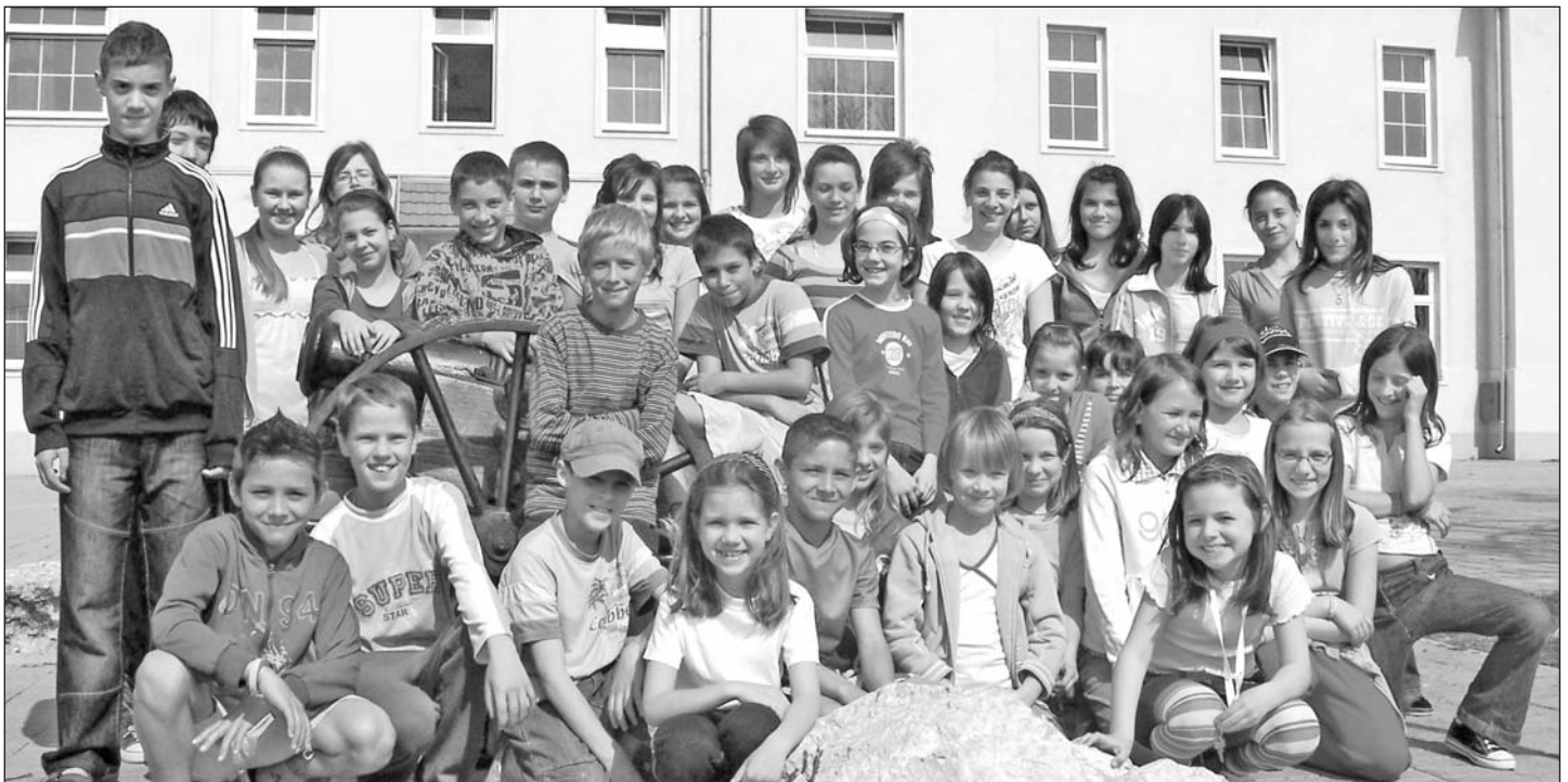
A versenyeken résztvevő diákok