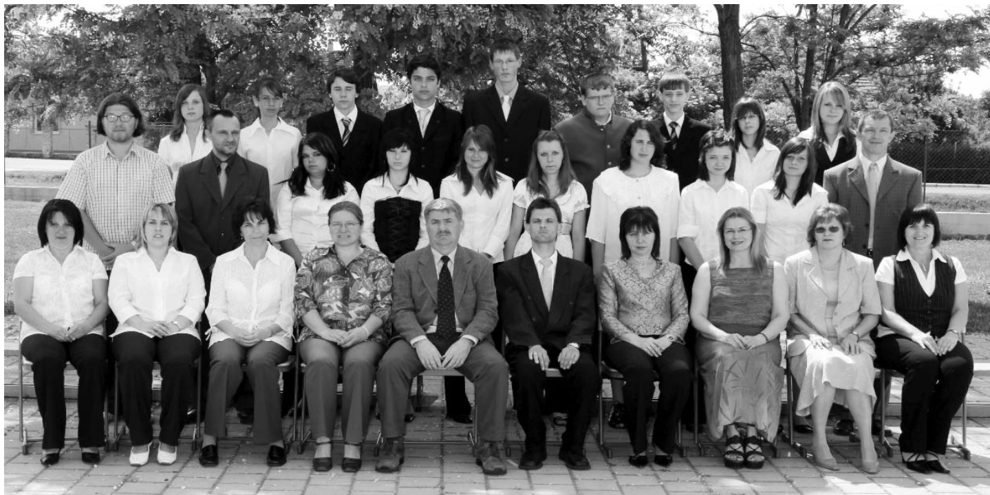
Osztálynévsor: Ballagó 8.osztály 2009.