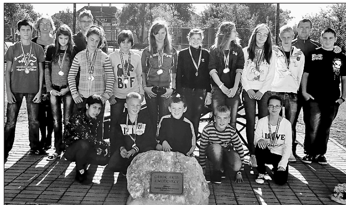
A sportsikereket elért tanulók csapata és felkészítőik