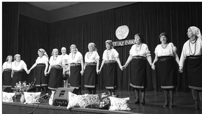
A Vadgalamb Népi Táncsoport részt vett a jó hangulatú megyei néptáncfalalkozáson a Pétfürdői Községi Házban.