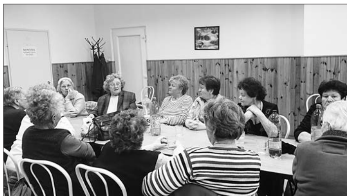
Gyönyörű versekkel emlékeztek meg a Költészet napjáról a nyugdíjas klub tagjai.