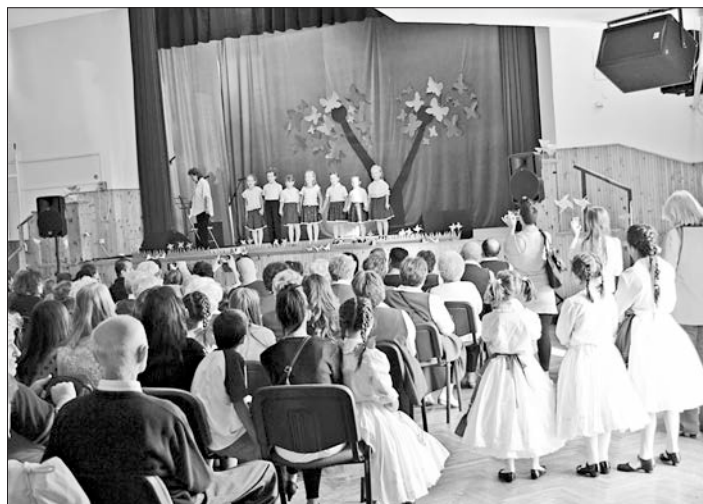
Ami a júniusi újságból kimaradt...

Ezúton köszönjük a májusi Tavasz Gálán fellépő gyermekeknek és felnőtteknek, a felkészítő pedagógusoknak és együttesvezetőknek a közreműködést, az együttműködést a jól sikerült előadás érdekében. Köszönet a hangosításért. Művelődési Ház