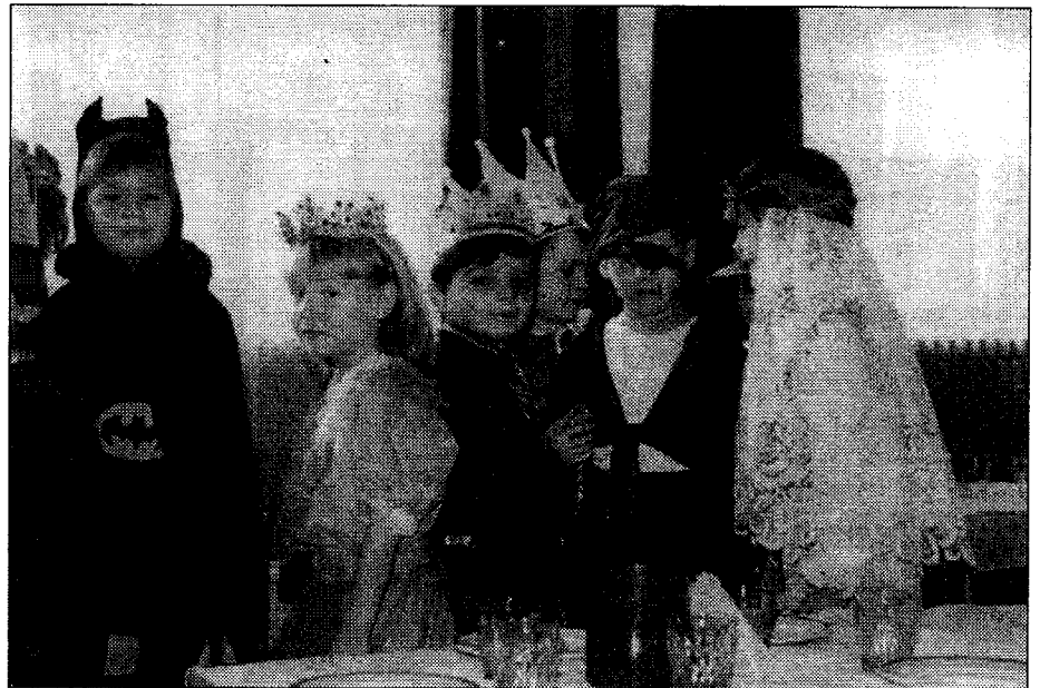
Felvételünk az óvodások farsangi multságán készült.