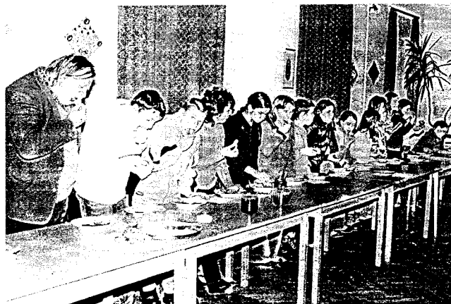
"A nagy zabálás" - fánkeve verseny