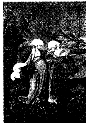
M.S. mester: Mária látogatása Erzsébetnél

Az időjárásjósló hiedelem szerint a Jakab napi időjárásból a télre lehet következtetni. Ha sok a felleg sok hó lesz a télen.