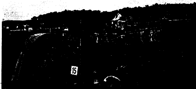
Gazdafogat-hajtó verseny - Öskü 2007.