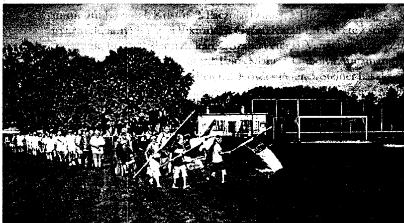
Öskü - Martos - A bevonulás