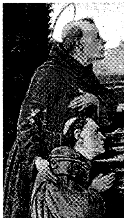
Páduai Szent Antal

Január 6. - Vízkereszt napja - A római egyház Epiphania Domini azaz Az Úr megjelenése elnevezésű ünnepe. A nyugati egyházakban e naphoz kötik a Háromkirályok vagy keleti bölcsek (Gáspár, Menyhért, Boldizsár) látogatását a kis Jézusnál és Krisztus megkeresztelkedését is.