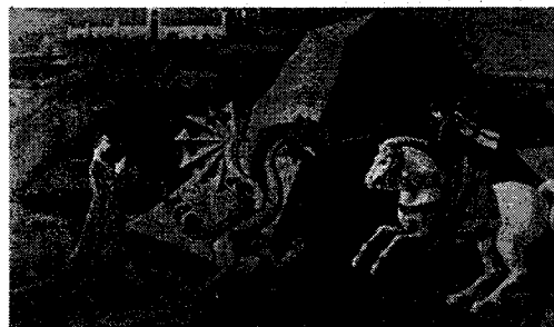
Paolo Uccello - Szent György és a sárkány

Pl.: Ha a varjú nem látszik ki a vetésből, jó lesz a termés. Ha e nap előtt megszólalnak a békák, az korai tavaszt, és nyarat jelent, vagy esőtlen nyarat. A Szent György nap előtti mennydörgés bő termést jósol.