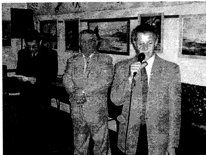
Borverseny - a zsűri értékelője

Ha a bort hűteni vagy melegíteni kell, akkor azt lassan, fokozatosan tegyük.