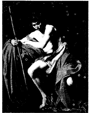
Caravaggio - Keresztelő Szent János

Szent-Iván napi tűzgyújtás már a XV. században is ismert volt. Így úzték el a kutak környékén rejtőzködő sárkányokat. Szokás volt különféle gyógynövényeket, illatos növényeket is égetni, melynek gyógyító, rovarok ellen védő hatást tulajdonítottak. A tűznek védő, termésközelítő, termékenységgeljáró hatást is tulajdonítottak.