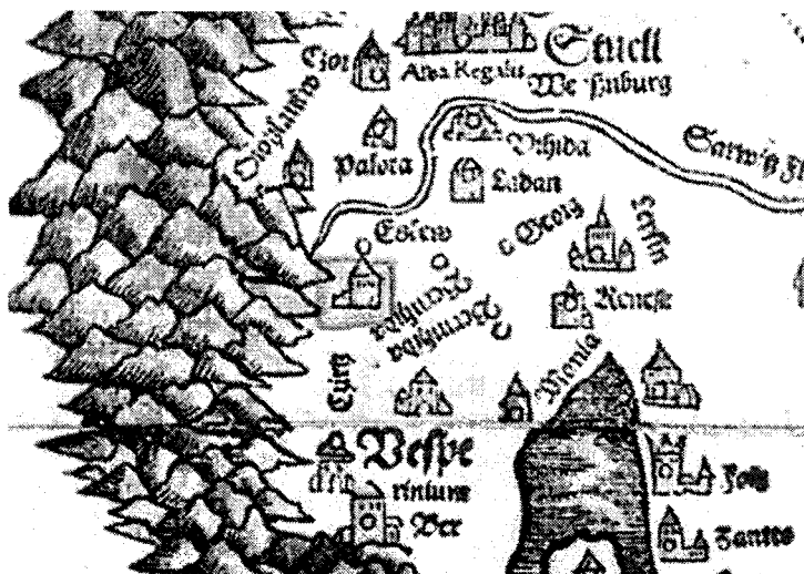
Részlet a Lázár-féle térképből

A középkor egyik méltatlanul keveset említett írásos emléke az Öskü is ábrázoló 1514-ben készített Lázár féle térkép, melynek részletét most itt megjelenítjük.