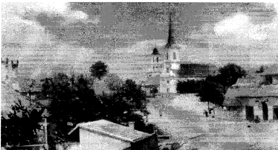
A mai Fő utca egy régi képeslapról ...