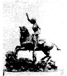
(A képen: Szent György és a sárkány)

Az ünnepet 1982-ben az UNESCO Nemzetközi Színházi Intézetének egy részlege, a Nemzetközi Táncbizottság hozta létre. Időpontját Jean-Georges Noverre francia táncos és balett-művész születésnapjára tették.