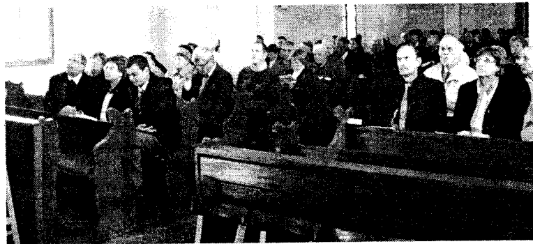
Evangélikus misszió

Megjelent: Napló, http://veol.hu/hirek/eszt-vendegdiakok-1575882