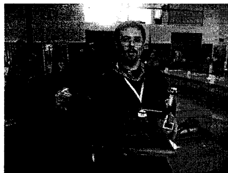
Gratulálunk, további sok sikert! Ösküi Hírek szerk.

Minden kategóriában bronz, ezüst és arany érmet osztottak ki. Először a Juniorok majd a felnőttek eredményhirdetése következett. Én a harcjármű kategóriában ARANYÉRMET szereztem. Ezen felül az összes kategóriát beleértve értékelték a három legjobb műanyag és papír-makettet. Itt elnyertem a Szlovákia Legjobb Papírmakettezője (I. helyezés) címet. A legvégén különdíjak kiosztására került sor.”