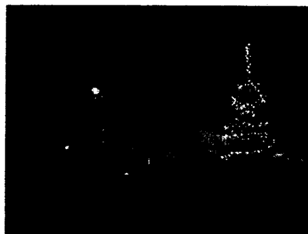
Az első adventi gyertyát meggyújtottuk: 2016. november 27.

Advent négy vasárnapja, illetőleg az azokat jeképező gyertyák a bizakodást, a reményt, a szeretetet és az örömet jelképezik. Az első vasárnap kardinális, hiszen ekkor veszi kezdetét a előkészületi időszak. Éppen ezért ez a nap arra batorít, hogy megnyílj, és nemcsak magadnak, hanem mások felé is. A szívedben is meg kell gyúlnia egy kis lángnak, ami a szenteste közeledtével egyre csak növekedik.