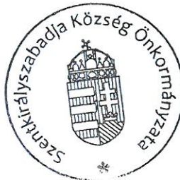
Gyarmati Katalin polgármester