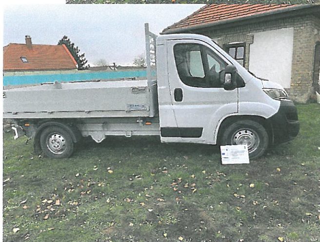
Beszerzett eszközeink: komposztáló ládák, alternáló kasza, teherautó