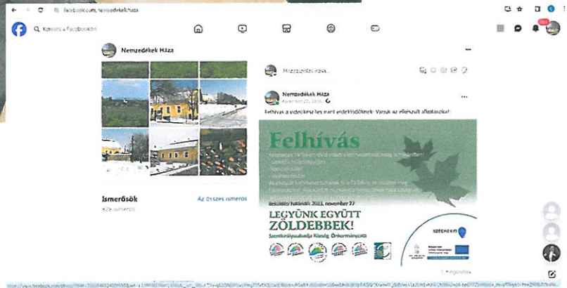
TikTok felhívás a Facebook-on.