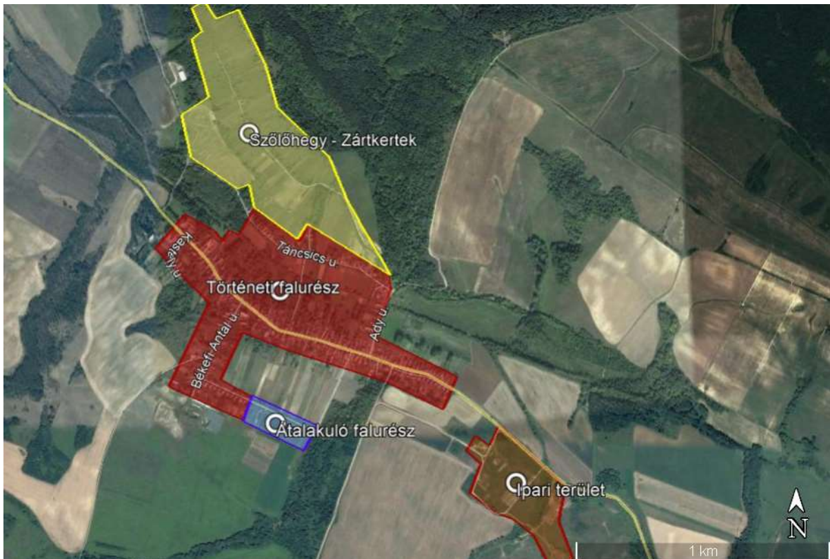
1. ábra Bakonyoszlop falurészi felosztása

Bakonyoszlop falurészei: 1. Történeti – 2. Átalakuló – 3. Szőlőhegy – Zártkertek – 4. Ipari terület – 5. Mezőgazdasági területek (külön térképen nem jelölt).